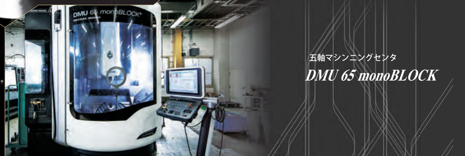
五軸マシニングセンタ DMU 65 monoBLOCK