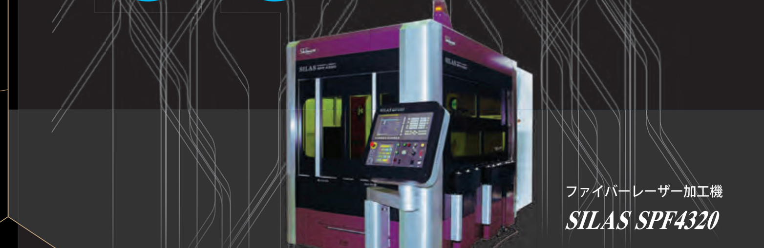
ファイバーレーザー加工機 SILAS SPF4320

私どもは、あらゆる製品の試作を行ってきた経験と実績を持っており、どんな試作品でも対応可能ですので、ご依頼をお断りすることは基本的にございません。たとえ始めて目にするような製品を見本にしたご相談でも、試作品を経て商品化までをサポートします。さらに、デザインにおいては、従来の3DCADはもちろんのこと、モデリングツール「フリーフォーム」を導入し、CADでは表現できないような意匠形状のデザインが可能です。ご注文は全国対応、短納期のご依頼もお任せください。